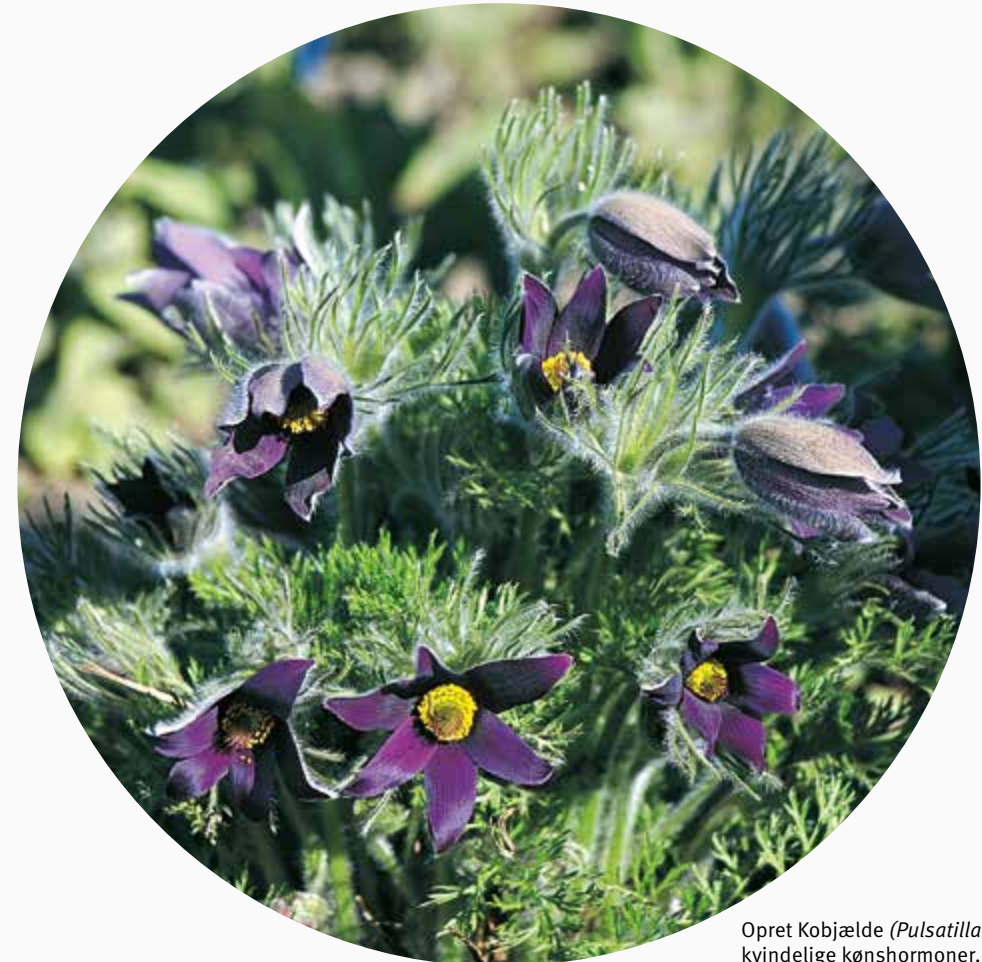
Opret Kobjælde ( Pulsatilla vulgaris ) stimulerer de kvindelige kønshormoner. Indgår i Ovaria comp.

Magnesium phos. virker effektivt lindrende på smerter og krampetilstande ved en såkaldt ”Varm 7’er”. Dryp 10-50 dråber i et glas varmt vand, gerne så varmt som muligt til voksne og ikke helt så varmt til børn. Det drikkes i små slurke over 15-30 min. Gentages efter behov. Denne metode kan også anvendes til beroligelse af uro, vrede, stress mm.