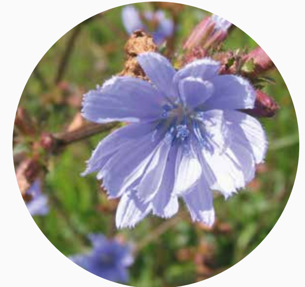
Cikorie ( Cichorium intybus ) styrker og regulerer lever og galde. Indgår i Cichorium comp. og Cichorium cum stanno.

Når bumserne er gået væk, eller undervejs i behandlingen, kan man understøtte opbygningen af en sund hud med DermaVital H , gerne sammen med en råkostkur. Vespa crabro comp. anvendes sammen med DermaVital H , hvis bumserne har efterladt ar.