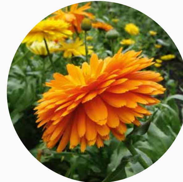
Morgenfrue ( Calendula officinalis ) virker sårhelende og styrkende på huden. Indgår i Morgenfruesalve.

Akne starter næsten altid i puberteten. Hos nogle er udbruddene små og varer kun ved i kortere tid. Hos andre er udbruddene større og mere synlige og kan vare ved i mange år, hvis der ikke kommer styr på det. Akne er psykisk belastende for mange unge mennesker, da det kan udvikle sig voldsomt og danne ar. Med en naturlig behandling renser man blodet og normaliserer hudens stofskifte. Det er desuden en