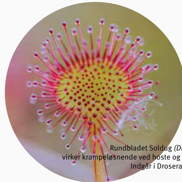
Rundbladet Soldug ( Drosera ) virker krampeløsnende ved hoste og astma. Indgår i Drosera comp.

Denne behandling medfører, at barnet hurtigt får det godt, selvom det har feber. Sekretionen fra næsen bliver mere tyktflydende som tegn på, at kroppen er kommet på den gode side af infektionen. Med den beskrevne behandling, hjælper man kroppen til at behandle sygdommen "udad". Hvis det ikke sker, kan sygdommen gå længere ind i kroppen og medføre f.eks. halsbetændelse, pande- og bihulebetændelse, bronkitis, lungebetændelse eller astma.