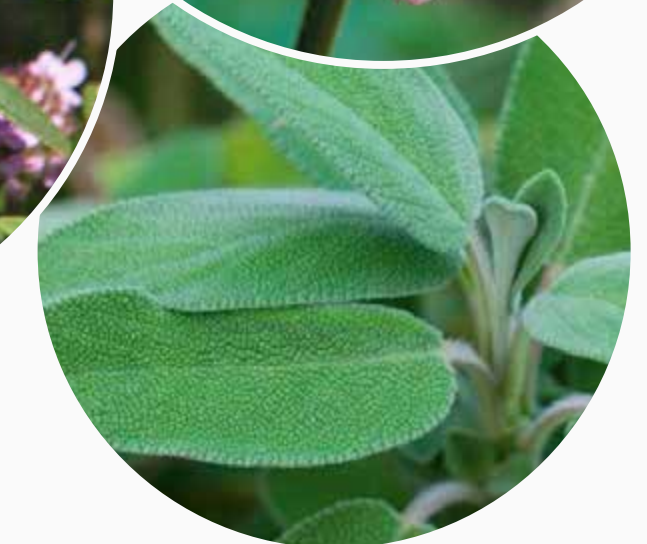
Smalbladet Solhat ( Equinicea angustifolia ), Have timian ( Thymus vulgaris ) og Lægesalvie ( Salvia officinalis ): Virker immunstimulerende og antiseptisk og indgår alle tre i Echinacea comp.