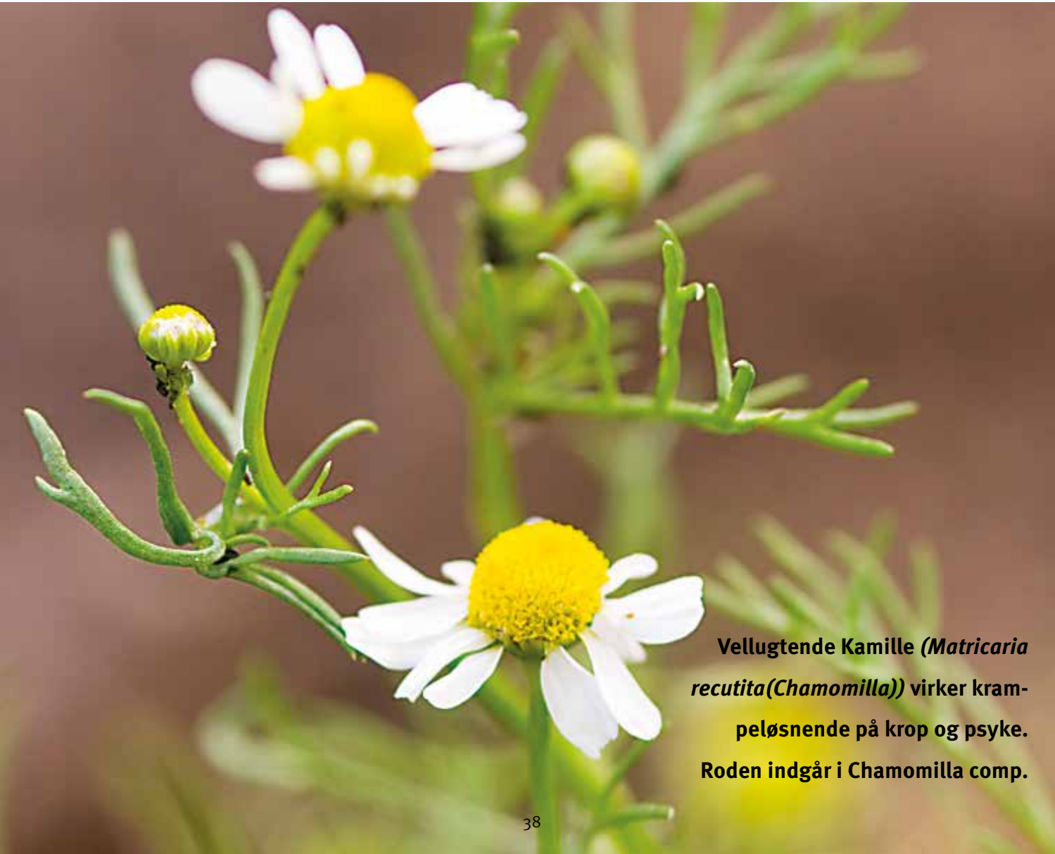
Vellugtende Kamille ( Matricaria recutita ( Chamomilla )) virker krampe- løsende på krop og psyke. Roden indgår i Chamomilla comp.

tel. Giv 10 – 25 dråber i lidt vand ved sengetid over en periode på 14 dage. Børn under 12 år gives istedet for Heparon Cichorium comp. Derudover er det gavnligt at give barnet mælkesyrebakterier i nogle uger.