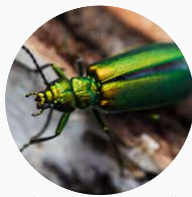
Spansk flue ( Lytta vesicatoria (Cantharis) ) afhjælper akut irritation i slimhinderne. Indgår i Cantharon.

Nogle børn er mere disponerede for urinvejsinfektioner end andre, og når man som forældre først én gang har oplevet, at barnet har haft blærebetændelse, er man som regel ikke i tvivl, om at det er blærebetændelse en anden gang. Det er en god idé at give et barn med urinvejsinfektion et veksselfodbad. Se side 58. Det er også vigtigt at holde barnet i ro og holde det varmt, når det har blærebetændelse. Læg en varmedunk på huden over blæren og giv barnet noget at drikke, så urinvejene kan blive skyllet igennem.