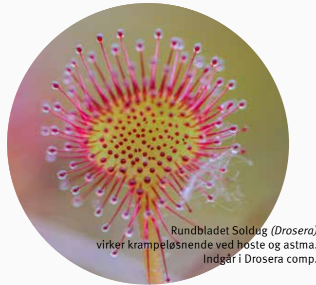
Rundbladet Soldug ( Drosera ) virker krampeløsende ved hoste og astma. Indgår i Drosera comp.

Denne behandling medfører, at barnet hurtigt får det godt, selvom det har feber. Sekretionen fra næsen bliver mere tyktflydende som tegn på, at kroppen er kommet på den gode side af infektionen. Med den beskrevne behandling, hjælper man kroppen til at behandle sygdommen "udad". Hvis det ikke sker, kan sygdommen gå længere ind i kroppen og medføre f.eks. halsbetændelse, pande- og bihulebetændelse, bronkitis, lungebetændelse eller astma.