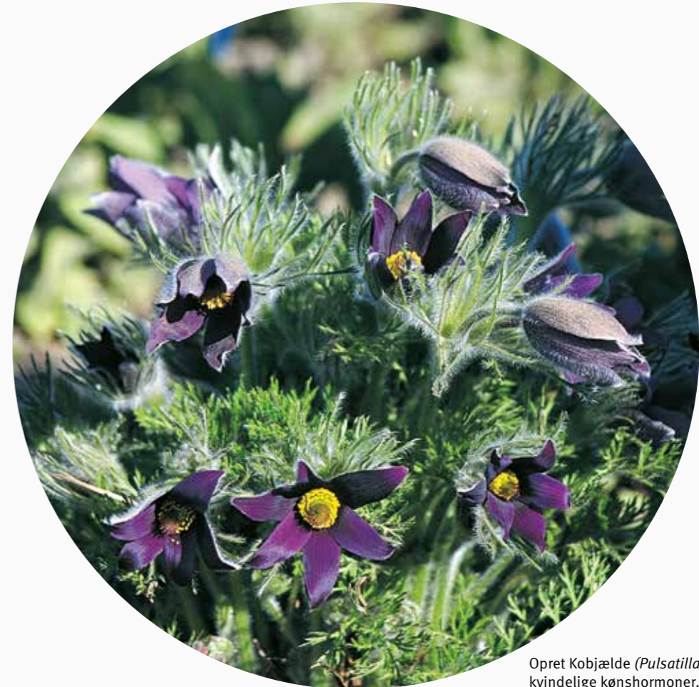
Opret Kobjælde ( Pulsatilla vulgaris ) stimulerer de kvindelige kønshormoner. Indgår i Ovaria comp.

Magnesium phos. virker effektivt lindrende på smerter og krampe tilstande ved en såkaldt ”Varm 7’er”. Dryp 10-50 dråber i et glas varmt vand, gerne så varmt som muligt til voksne og ikke helt så varmt til børn. Det drikkes i små slurke over 15-30 min. Gentages efter behov. Denne metode kan også anvendes til beroligelse af uro, vrede, stress mm.